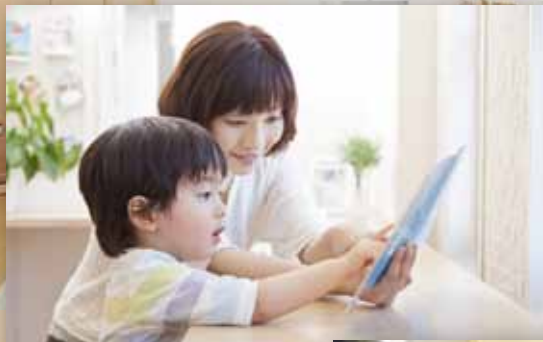
子ども目線のお家に Child Care