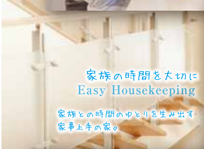
家族の時間を大切に Easy Housekeeping